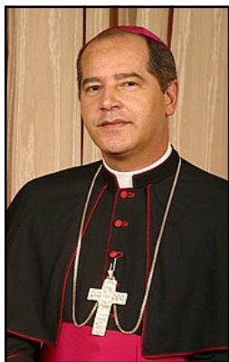
Dom Walmor Oliveira

Artigo escrito para o Portal da CNBB em 18 de Junho de 2010 às 08h55.